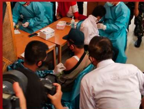
Menko Mahfud dan Menteri Tito Tinjau Vaksinasi Usia Pelajar di Natuna

f @diskominfonatuna i @diskominfonatuna t @diskominfontn v diskominfonatunz