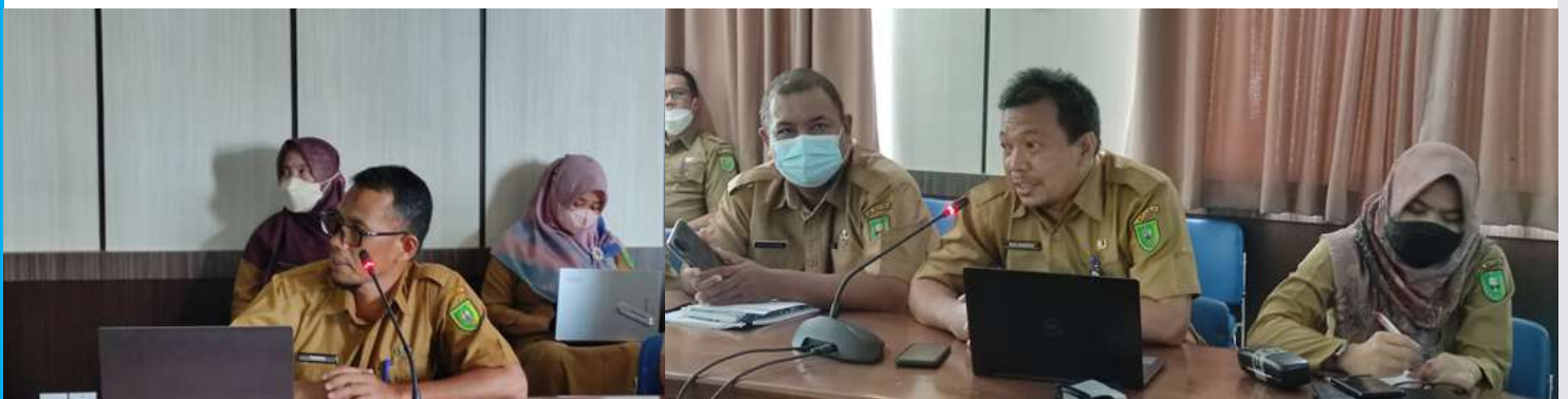
GELAR RAKOR RPJMD 2021 – 2026, PEMKAB NATUNA FOKUS PADA SMART BIROKRASI

Dalam rapat tersebut masing masing kepala OPD menyampaikan secara rinci terkait perencanaan , tujuan , sasaran serta strategi dalam menciptakan pelayanan publik yang prima. Pemkab Natuna berharap dengan dilaksanakan Rakor RPJMD ini dapat menjalin sinergitas setiap OPD yang output akhirnya adalah terciptanya Smart Birokrasi. (Diskominfo/Patli).