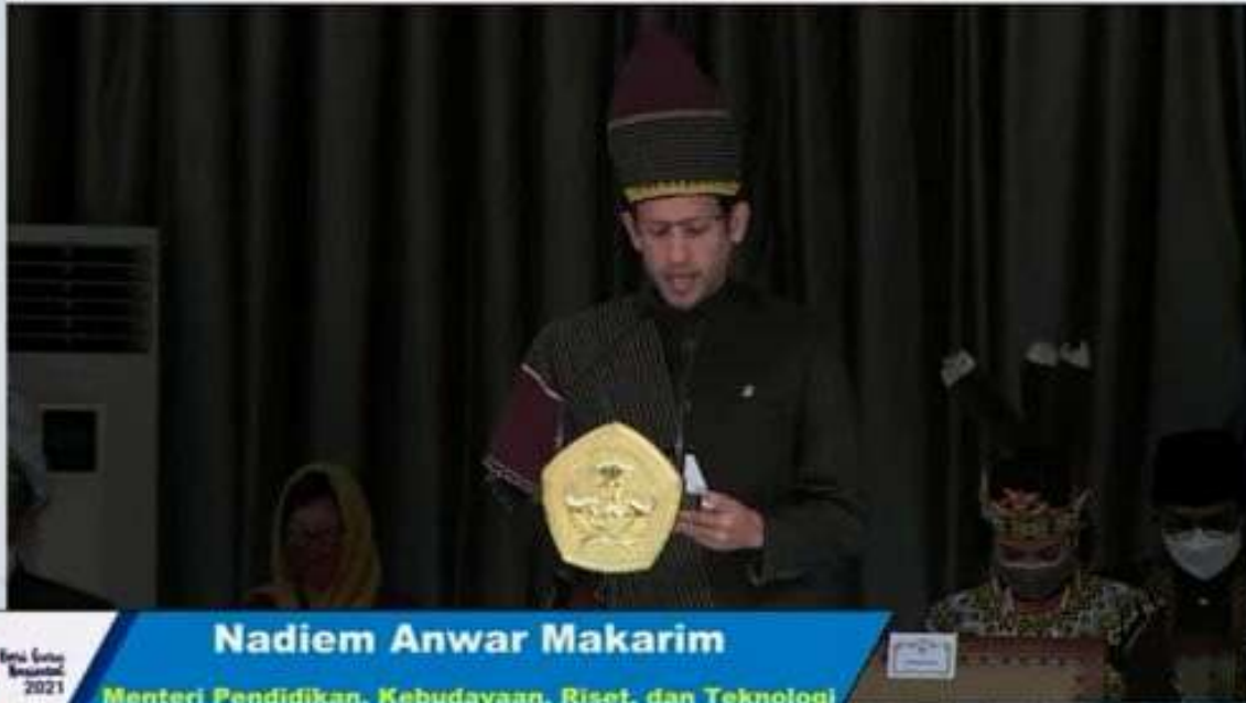
Nadiem Anwar Makarim

Menteri Pendidikan, Kebudayaan, Riset, dan Teknologi