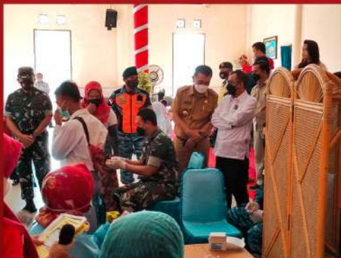
Menko Mahfud dan Menteri Tito Tinjau Vaksinasi Usia Pelajar di Natuna

f @diskominfonatuna i @diskominfonatuna t @diskominfontn v diskominfonatunz